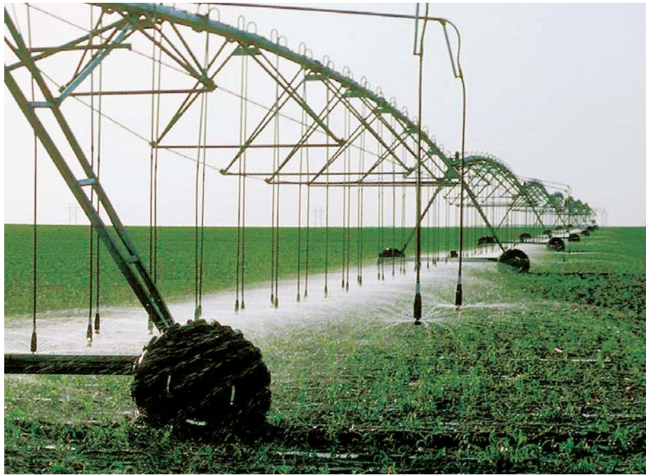
En materia de agua, uno de los mayores riesgos de cara al futuro es que se haga un manejo más político y menos técnico.

Una de las contradicciones dentro de la ley es que mientras en sus principios (artículo III) proclama la descentralización de la gestión pública del agua, a la vez estipula una es-