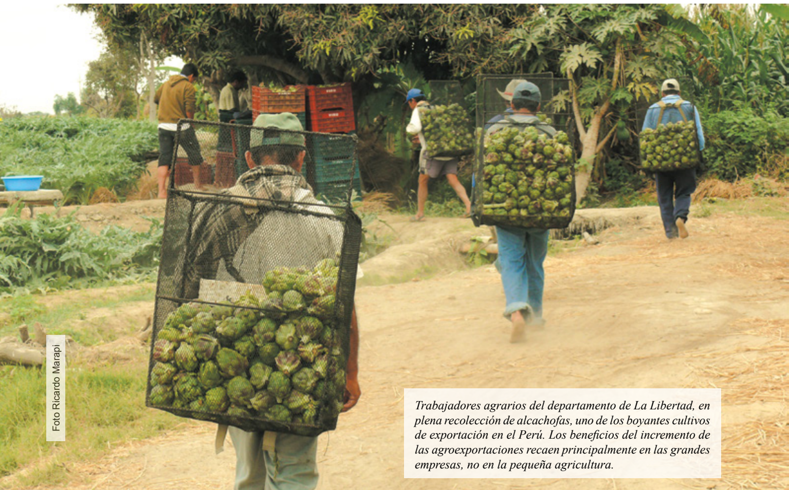
Trabajadores agrarios del departamento de La Libertad, en plena recolección de alcachofas, uno de los boyantes cultivos de exportación en el Perú. Los beneficios del incremento de las agroexportaciones recaen principalmente en las grandes empresas, no en la pequeña agricultura.

atención es que las condiciones en las que exportan ambos grupos de productores son bastante disímiles, poniendo en cuestionamiento si el Estado es realmente imparcial en su apoyo o incentivo a la exportación.